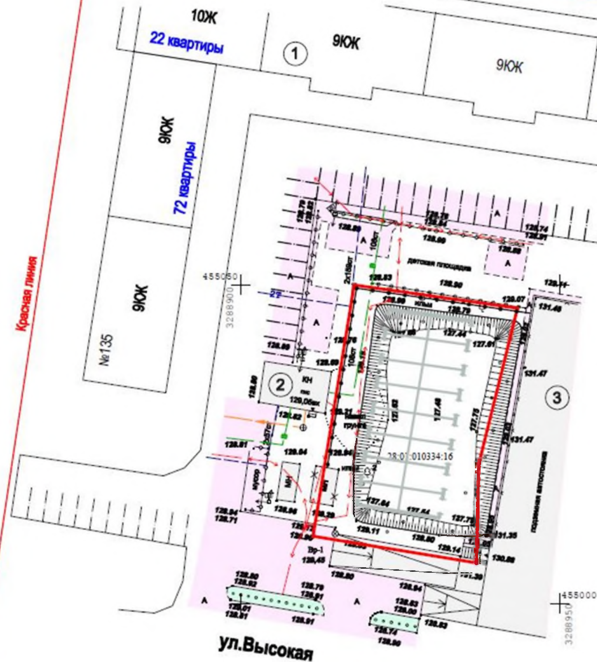
Экспликация зданий и сооружений